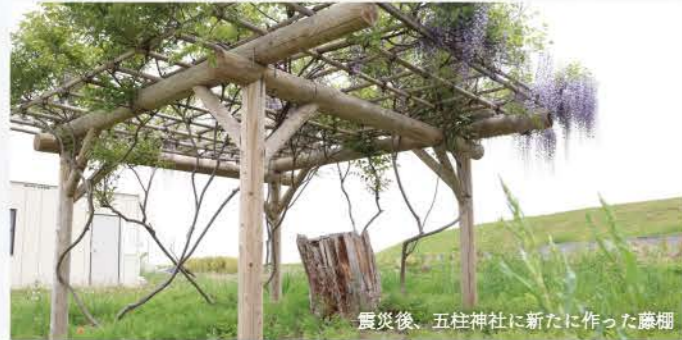
震災後、五柱神社に新たに作った藤棚