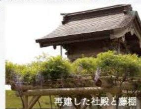
再建した社殿と藤棚

フジの大木と神社は、東日本大震災の大津波で無残にも押し流されてしまいましたが、なぎ倒されたフジの根から、なんと新たなツルが伸びてきたのです。藤塚の人々は、復興のシンボルとして社殿の再建と新たな藤棚を作りました。被災を乗り越えた「復興藤」。これからの未来、100年先、その先まで咲き誇ることを願います。